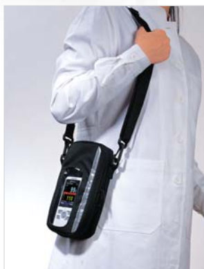
Футляр для переноски